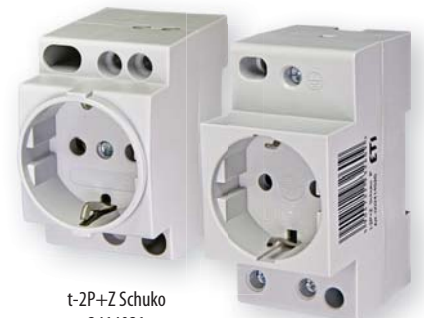
t-2P+Z Schuko 2414021