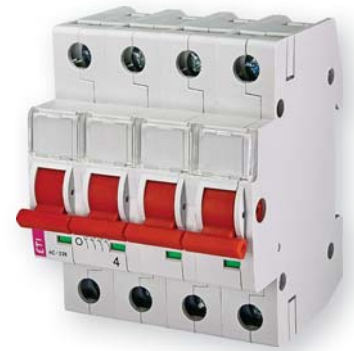
SV 463 ..4125