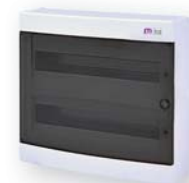
ЕСТ 2x18 РТ