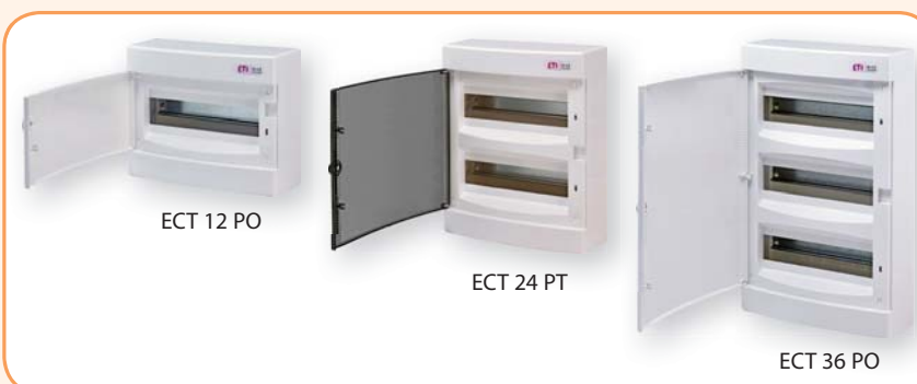
ЕСТ 12 РО