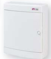
ЕСТ 24 РО