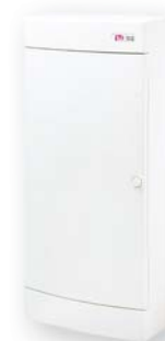
ЕСТ 48 РО