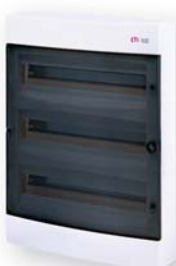
ЕСТ 3x18 РТ