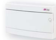
ЕСТ 18 РО