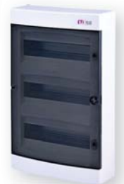
ЕСТ 36 РТ