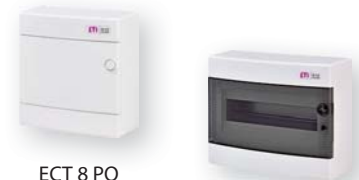
ЕСТ 8 РО